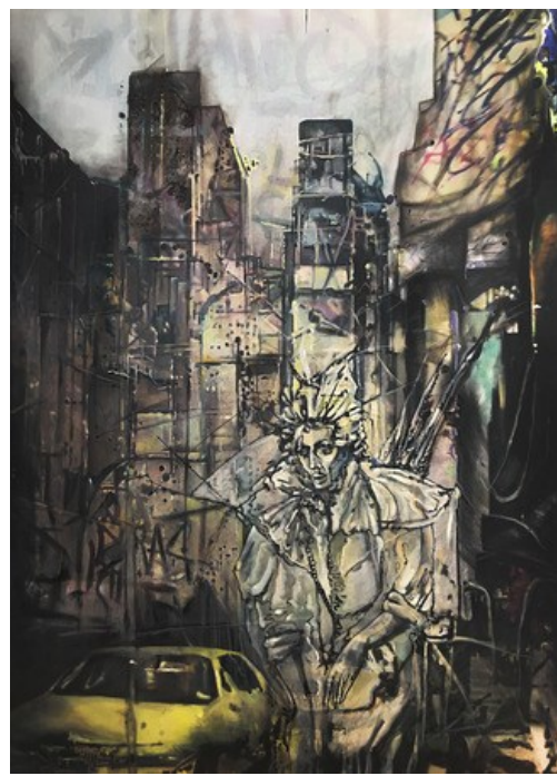
«Мое искусство - это мелодии моих переживаний».