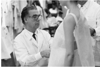
Превью выставки, посвященной дому Balenciaga