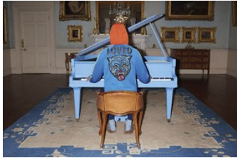
Коллаборация недели: Алессандро Микеле для Mr. Porter