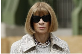
Про Анну Винтур снимут сериал