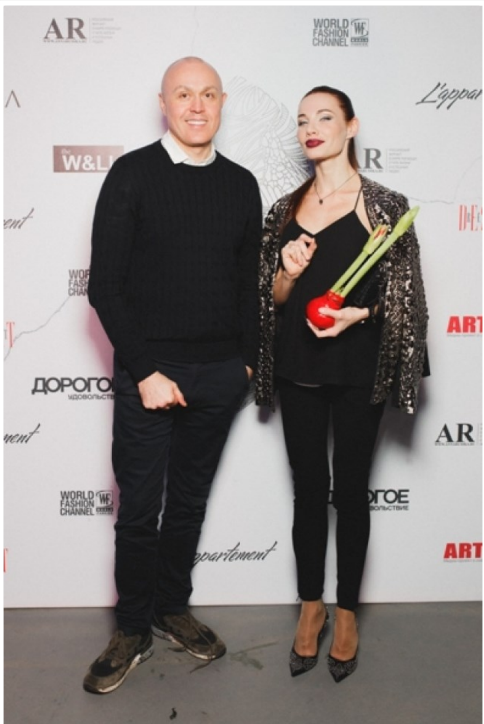
«Я всего лишь показываю вам то, что живет с вами каждый день»