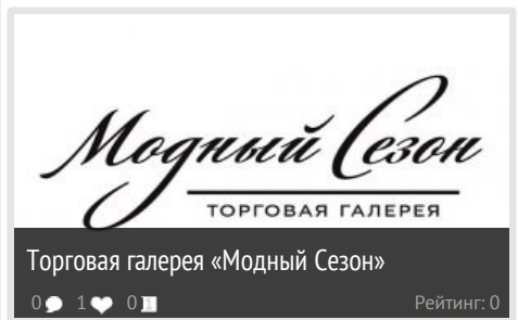
Торговая галерея «Модный Сезон»